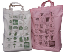
県立歴史と民俗の博物館 オリジナルエコバッグ 2色セット