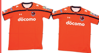
大宮アルディージャ レプリカユニフォーム ※サイズは選べません。