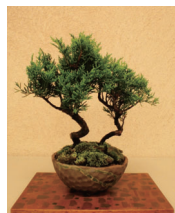
大宮盆栽村 盆栽 ※写真はイメージです。