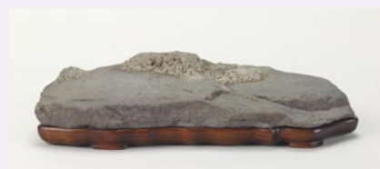
安倍川石 銘「春近」 大宮盆栽美術館蔵

主催 一般社団法人 日本水石協会 http://www.suiseki-assn.gr.jp/index.html