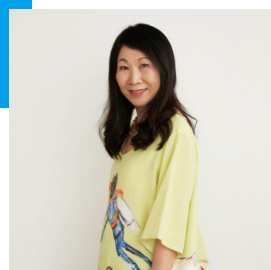
津森千里 ファッションデザイナー