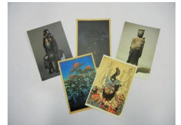
埼玉県立歴史と民俗の博物館 オリジナルポストカード (5枚組み)