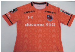
大宮アルディージャ 「レプリカユニフォーム」 ※サイズは選べません。写真はイメージです。