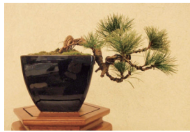
大宮盆栽村 盆栽 ※写真はイメージです。