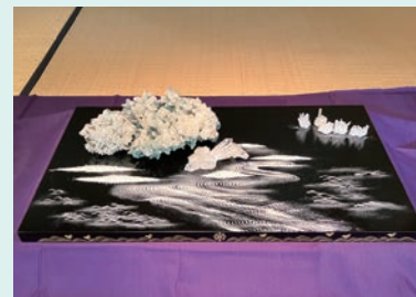
「未来都市」美多賀鼻千世作